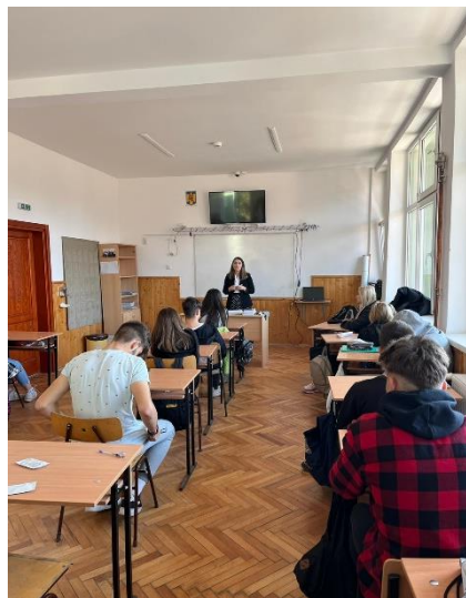
Avocat din Baroul Harghita care le explică elevilor că necunoașterea legii nu scuză pe nimeni

A ctivitatea tinerilor are la bază modulele FAST susținute de avocați în 17 școli din județ, în perioada martie – iunie 2022.